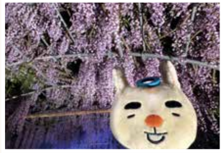
えさし藤原の郷「藤のトンネルライトアップ」に行ってきたピン！ フジの香りがとっても良かったピン～♡