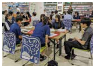
令和7年度の活動の様子

※受講後、希望者には、まちづくり活動の現場を体感できるフィールドワークを予定しています。(日程などの詳細は申込者へお知らせします)