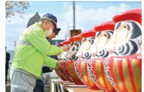
交通安全祈願を込め、だるまを開眼する参加者たち

市交通安全対策協議会が主催する交通安全祈願式が胆沢南都田の交通安全地蔵尊前広場で行われました。当日は関係者を含め約60人が出席。交通事故による犠牲者を供養するとともに、交通事故の撲滅を願って胆沢3地区のだるまに入眼しました。入眼されただるまは参加者の手により胆沢地区内をリレー形式で周回し、地域全体で交通安全に対する意識を高めました。