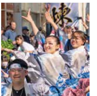
5月3、4日に行われた江刺甚句まつりで踊りを披露

今後は、できることをさらに増やし、任せてもらえる仕事の幅を広げていきたいです。自分の成長が会社への貢献につながるよう努力しながら、地元奥州市にも、イベントなどを通じて関わっていきたくらいなと思っています。