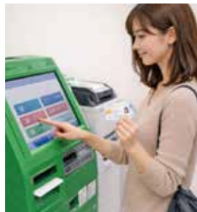
マルチコピー機で証明書を 取得するイメージ

期間中は、1通200円のコンビニ交付手数料が10円になります。窓口で取得する場合と比べて290円安く利用できますので、ぜひこの機会にご利用ください。