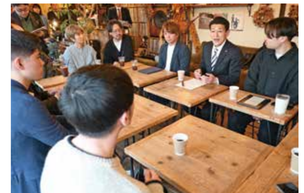
市の地域課題などについて意見を交わす参加者たち

市の地域課題について市長と市民が意見を交わす「奥州ミーティング」が水沢地域のカフェで試験的に開催されました。市長が市民と直接対話し、今後のまちづくりに生かすことを目的に行われ、今回は水沢市街地のにぎわい創出をテーマに意見交換。参加した地元の若手経営者ら10人は、まちづくりに関する意見や思いを自由に語り、活発な対話が繰り広げられました。(関連：20頁)