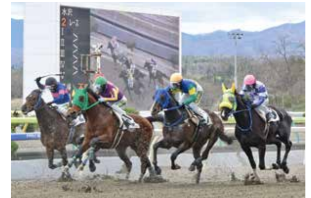
前日の雨で重くなっているコースを激走する競走馬

2026シーズンの岩手競馬が水沢競馬場で開幕しました。「それは、人と馬のドラマ。」を新シーズンのキャッチコピーに掲げ、初日は全11レースで熱戦を展開。会場では開幕を記念し、市公式マスコットキャラクター「おうしゅうたろう」グッズの配布や「祝い餅つき振舞隊」によるイベントも行われ、多くの競馬ファンや家族連れでにぎわう1日となりました。