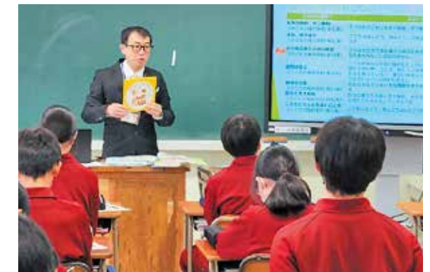
スライドを使った説明に耳を傾ける生徒たち

市は「こどもの権利」について考えてもらおうと水沢南中学校の2年生199人を対象に出前授業を行いました。生徒たちは絵本や演習などを通じて、子どもが持っている権利やその大切さ、権利と責任のバランスについて学習。受講後のアンケートでは「家族や友達に、今日の内容を話すことができそう」と回答が寄せられるなど、生徒たちは「こどもの権利」への理解を深めていました。