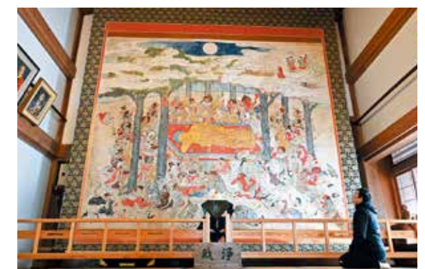
拝観者と比較するとその大きさが際立つ涅槃図

正法寺では、冬の特別公開で縦411センチ、横484センチの「釋迦涅槃図」が3月末まで展示されています。涅槃図は仏教絵画の一種で、この作品は釋迦が沙羅双樹の間に北枕で横たえ入滅する姿を描写。同寺に300年以上前から保管されている書物には、この作品にまつわる記述があり、来場した拝観者は壁一面を覆う圧巻の作品を鑑賞しながら、長い歴史に思いをはせていました。