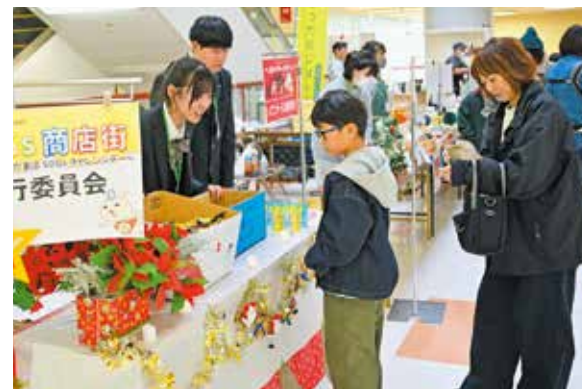
クイズを楽しみながらSDGsへの理解を深めた参加者

高校生を中心に10代の若者が活動するNPO法人「YOUTH SDGs SHOP」主催の「SDGs 商店街～高校生と地域が創るSDGs チャレンジデー～」がメイプルで開かれました。会場には1,000人以上が来場し、参加者は買い物やワークショップなどを通じて日常から取り組めるSDGsを体験。何気ない行動でも持続可能な社会につながることを実感していました。