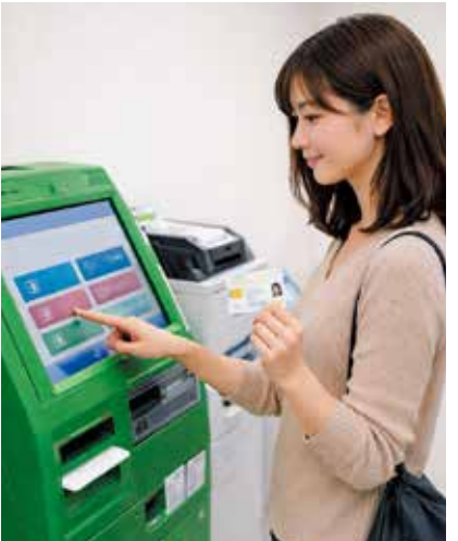
マルチコピー機で書類を取得するイメージ

マイナンバーカードをマルチコピー機（キオスク端末）にかざすだけで、コンビニで住民票や課税証明書などを受け取ることができます。マイナンバーカードがあれば、急に書類が必要なときに最寄りのコンビニで各種証明書が取得可能です。引っ越しや転勤、入学手続きなど各種証明書が必要となる場合がありますので、ぜひご活用ください。