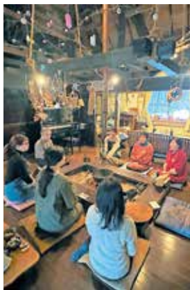
「ぼつんと一軒家」の主人の話で盛り上がった体験会

衣川の皆さまにとって「当たり前」の日常が、移住者や観光客にはかけがえない「宝の山」になります。これからも衣川の魅力を引き継ぎ、お伝えしていきます。