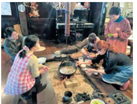
いろいろを使ってはっと作りに挑戦する参加者

このたび、衣川の「ぼつんと一軒家」を舞台に衣・食・住・自然の知恵を学ぶ「衣川の暮らしの魅力体験3ヶ月連続講座」を開催しました。11月は「冬の寒さを楽しむ準備！ ログハウスのDIY体験」として住まいの知恵を、12月は「伝統の発酵文化と郷土料理を楽しむ会」で食の魅力、そして1月は「竹あかりと花炭作り体験」を通じて地域資源の活用を、それぞれお届けしました。