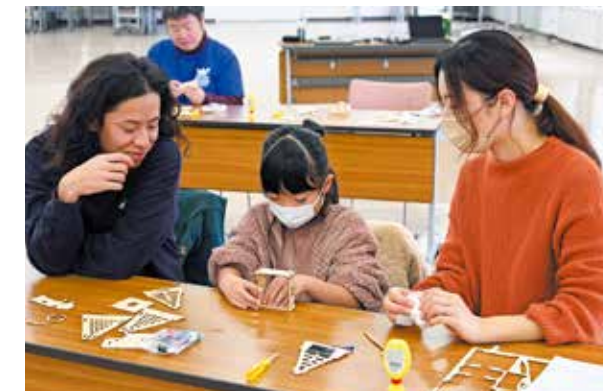
ねじやボンドを使ってソーラーハウスを組み立てる親子

パナソニック(株)の「エネルギーの創・蓄・省」環境学習会が市役所本庁舎で開催されました。親子3組が参加し、太陽光発電の仕組みや役割を学習。その後、ソーラーパネルを使った工作に取り組み、土台を作ったりLED基板を取り付けたりしてソーラーハウスを完成させました。出来上がった作品のライトが点灯すると、子どもたちはうれしそうな表情を浮かべていました。