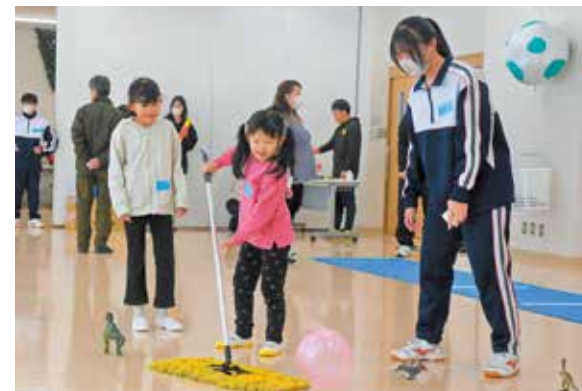
オリジナルの要素を加えたニュースポーツに挑む参加者

市協働のまちづくりアカデミー11期生が主催する「奥州・はんと」が江刺愛宕地区センターで開かれました。イベントは「宝探し」をテーマに食とスポーツの2部で構成され、参加者はゲームを楽しみながら市の魅力を調査。スポーツを選択した親子など9人は、ジャングルのよう装飾された会場で、さまざまな種類のスポーツに挑戦し、体を動かしながら楽しんでいました。