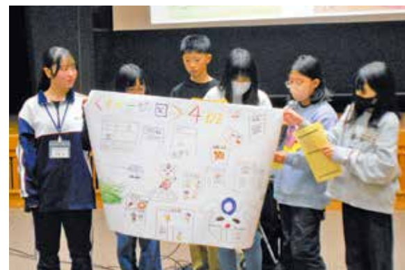
話し合いの結果を模造紙にまとめ、発表する児童たち

小学生がまちづくりについて考えるワークショップが江刺総合支所で開催されました。市公式マスコットキャラクター「おうしゅうたろう」を活用した未来のまちを考える企画で、江刺地域の各小学校の5年生20人が参加。ボランティアとして参加した岩谷堂高校の生徒からアドバイスを受けながら、子どもたちは未来のまちへ向けて、夢やアイデアを膨らませていました。