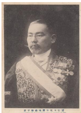
★逓信大臣 ダンディー新平