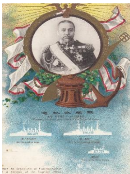
★嫡男一蔵氏セレクト 日露戦争絵葉書