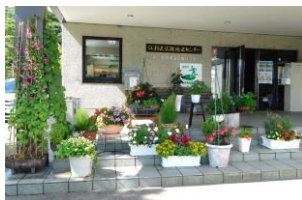
団体の部 10 広瀬地区センター様

江刺田圃(金石自動車入口で、国道107号線との交差点付近)です。除草の中に花壇を作りました。