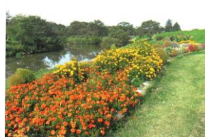
団体の部 2 粟谷 下川原水辺環境をよくしよう会様

レイアウトもカラフルに楽しめました。雨続きの後の猛暑に成長が速れて心配しました。