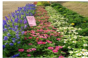
団体の部 3 田原 原体長寿会様

月2回会員の活動で花の手入れ除草等をしています。水辺の美観を良くしようと掛けて活動しています。