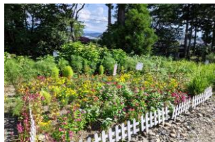
団体の部 1 岩谷堂 フラワー一親様

レイアウトもカラフルに楽しめました。雨続きの後の猛暑に成長が速れて心配しました。