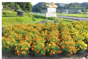
団体の部 4 藤里 五区長生会様

長く楽しんでもらえるように、雨・暑さに良い花を選びました。また、花が際立つように土があまりみえないように植えました。