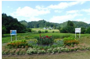
団体の部 11 広瀬 宝岩寺集落「はなぐみ」様

多品種をバランス良く、組み合わせない様に工夫して植えました。センターを利用される方の心の癒しになればと思っています。