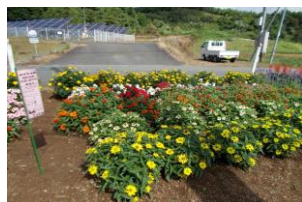
団体の部 13 稲瀬 自田自治会様

17年目の集落花壇です。昨年の12月にわくをとりかえました。花だんづくりの活動を継続することで集落の交流がいつそう図られています。