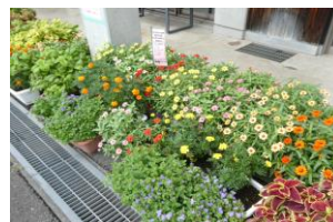
団体の部 8 梁川地区センター様

色どりを考えながら植えました。いつも写真写りが良いので今年こそは美しく咲きますように！