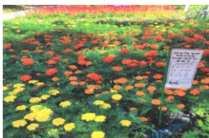
団体の部 7 米里 九区ふれあい花壇様

色どりを考えながら植えました。いつも写真写りが良いので今年こそは美しく咲きますように！