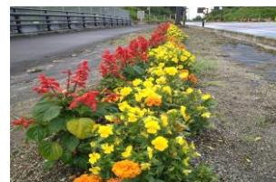
団体の部 9 梁川 第4区自治会様

前年に使用した土に、堆肥、EMボカシ肥を加え土作りをしています。苗を植えてからは、EM活性液を100倍希釈したものを散布します。今年は暑い日が続きましたので、水切れをおこさないよう気をつけたりしました。