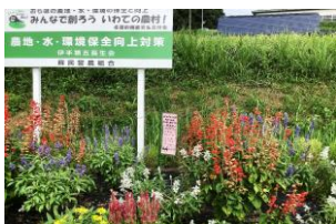
団体の部 5 伊手 第五長生会様

長く楽しんでもらえるように、雨・暑さに良い花を選びました。また、花が際立つように土があまりみえないように植えました。