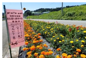
団体の部 6 米里 2区自治会様