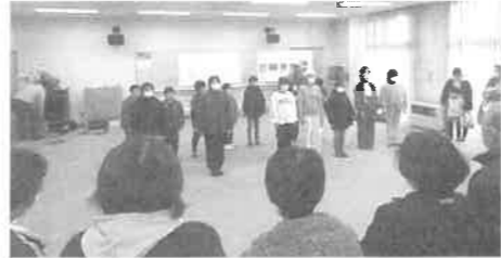
地域の人にお礼の口唱を行う子ども達