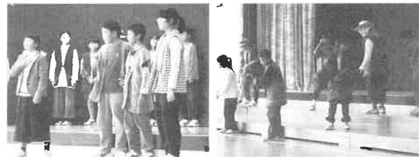
学習したことをもとに学習発表会で発表をする6年生