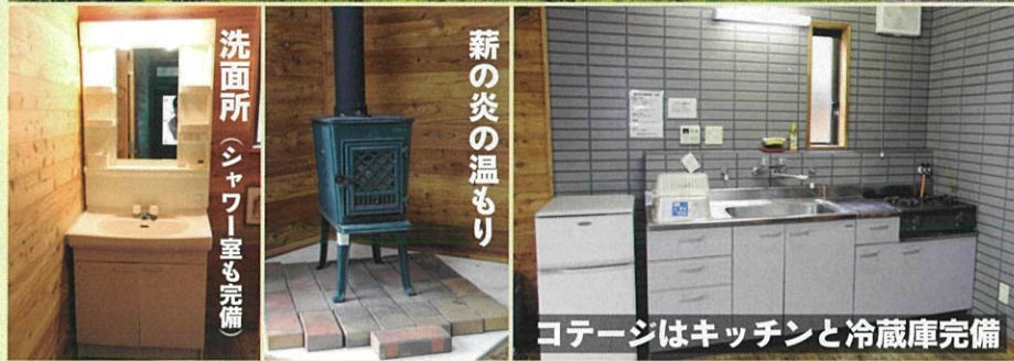
洗面所（シャワー室も完備）