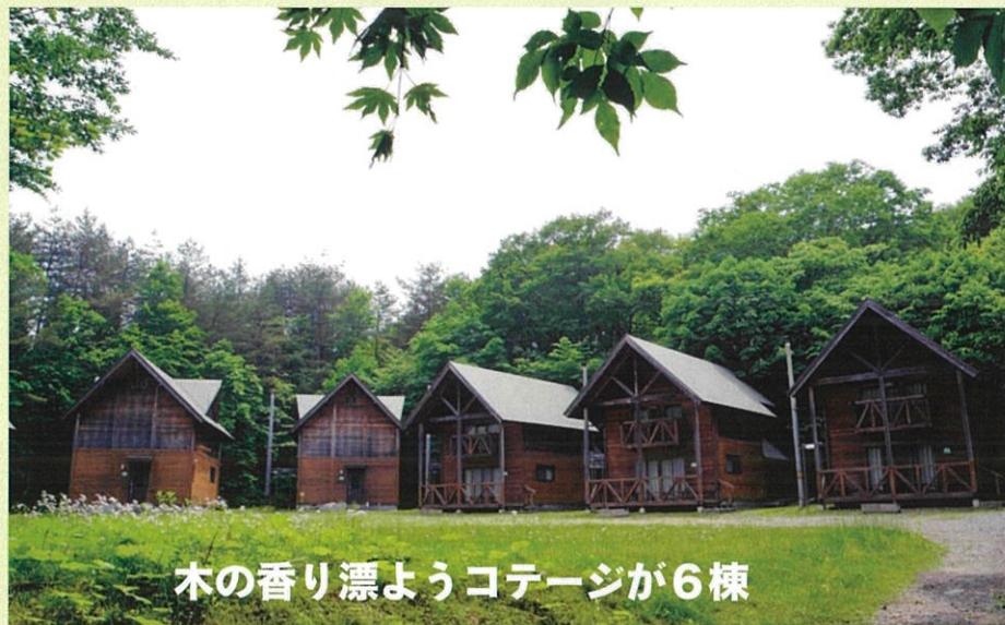
木の香り漂うコテージが6棟