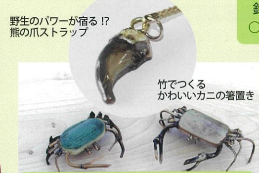
竹でつくる かわいいカニの箸置き