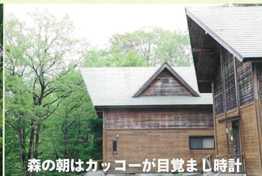
森の朝はカッコーが目覚まし時計