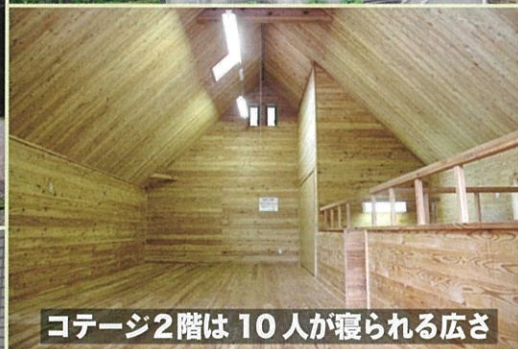
コテージ2階は10人が寝られる広さ