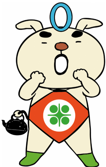
奥州市公式マスコットキャラクター 「おうしゅうたろう」