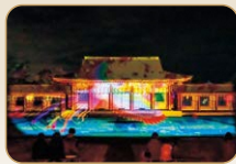
プロジェクションマッピング