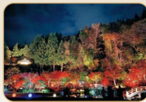
紅葉ライトアップ