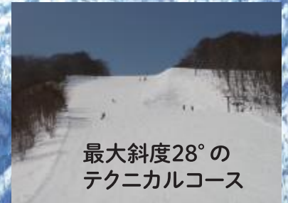
最大斜度28°の テクニカルコース