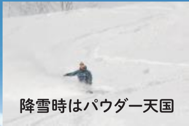
降雪時はパウダー天国