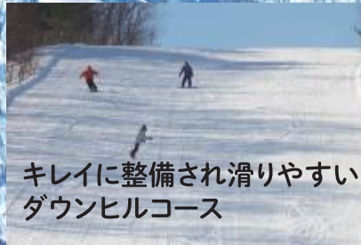
キレイに整備され滑りやすい ダウンヒルコース