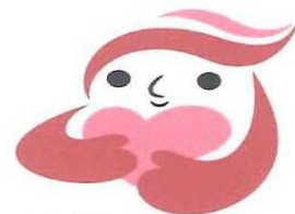
犯罪被害者支援シンボルマーク「ギョっとちゃん」

（公社）いわて被害者支援センターの相談窓口について 同センターは、犯罪や交通事故の被害を受けた方やその御家族を支援する民間の団体です。電話・面接相談や、病院等への付き添い支援を行っています。