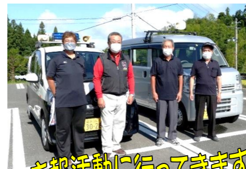
広報活動に行ってきます!!

環境保健部では、9月12日(日)午前8:30から、市の特定健診受診率向上を目指して、田原地内を巡る広報活動を行いました。