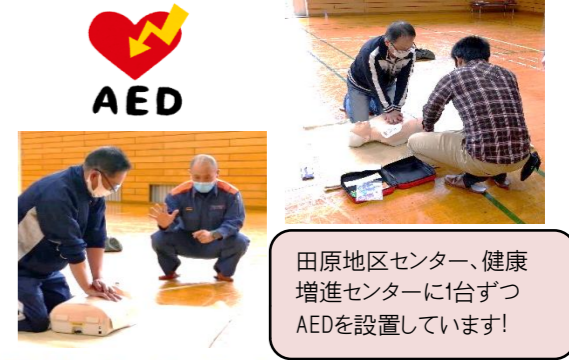
田原地区センター、健康増進センターに1台ずつAEDを設置しています!

119番通報してから救急車が到着するまでに、その場に居合わせた人が適切な応急手当を行えるよう、心肺蘇生やAEDの使用方を身につけておくことが大切です!