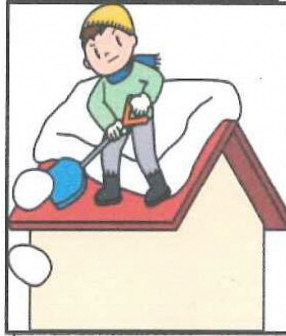
屋根からの転落に注意しましょう

発行 田原駐在所 35-8850 協力 田原地区センター 田原振興会 地域安全部 (防犯・安協・母の会)