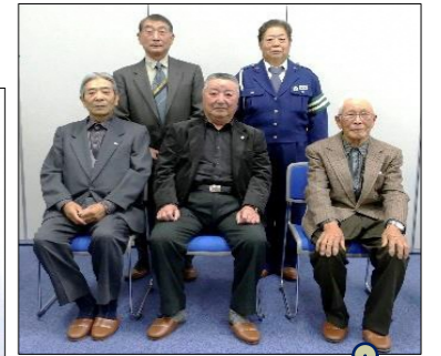
交通安全功労者 優良運転者 受賞の皆さん