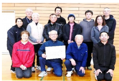
準優勝 小田代自治会