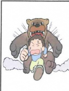
熊の目撃通報が多くあります!

行在所 田原駐在所 35-8850 協力 田原地区センター 交通安全母の会 安協田原分 安協田原防犯協