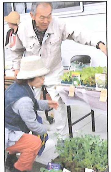
様々な野菜や花の苗も出品されました。