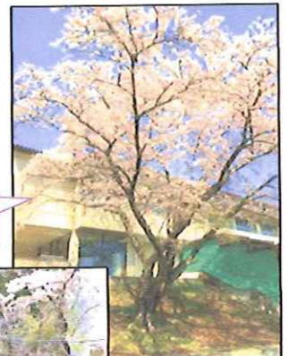
藤里小学校西昇降口裏

藤里地区センター周辺には、見事な桜が咲く所が多くあります。今年も見事な桜が咲きましたので、一部をご紹介します。