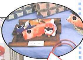
可愛らしいこいのぼりの置物