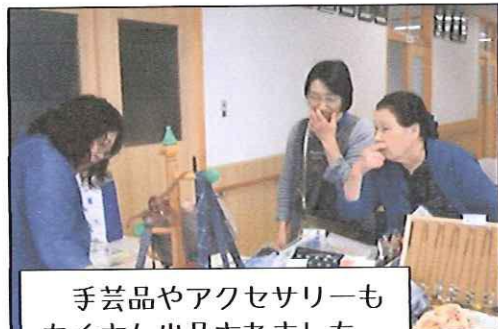
手芸品やアクセサリもたくさん出品されました。

次回は8月11日(土・山の日)の朝市を予定しています。多くの皆様のご来場をお待ちしています。