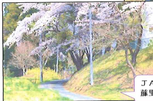
J AのATMから藤里小へ続く道路