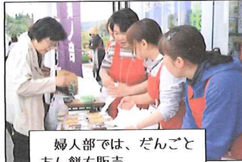
婦人部では、だんごとあん餅を販売。