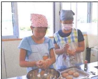
ハンバーグは同じ大きさにしないとケンカになるからね。