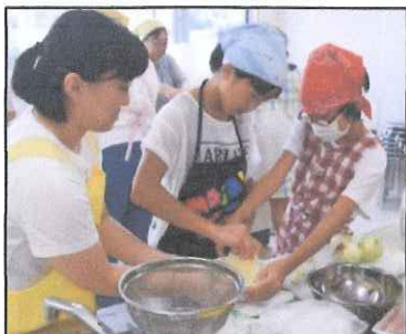
りんごのすりおろしも量が多いと疲れてくるね…。