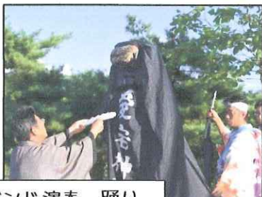
神楽、権現舞、バンド演奏、踊り、歌、厄年連の演舞など盛りだくさん!