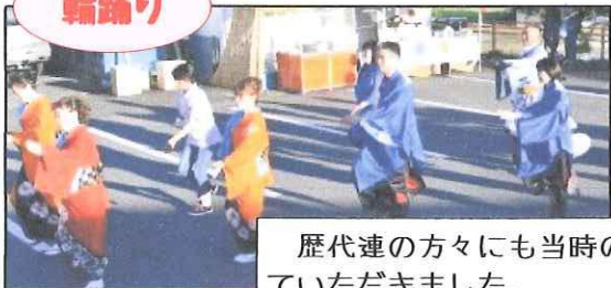
歴代連の方々にも当時の衣装で参加していただきました。