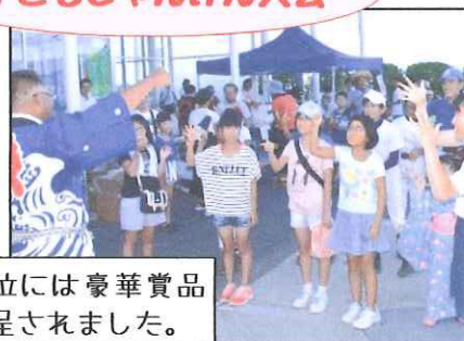
上位には豪華賞品が贈呈されました。