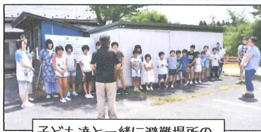
子ども達と一緒に避難場所の確認をしました。