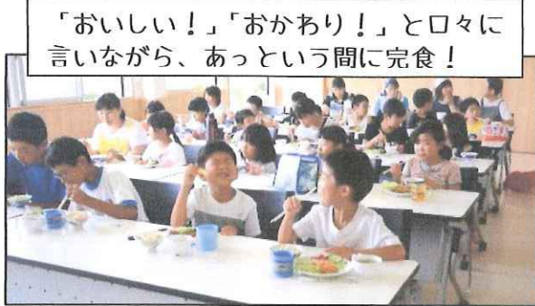
「おいしい!」「おかわり!」とロ々に言いながら、あっという間に完食!

出来上がった料理は、ふじの子クラブの全児童、保護者、指導員、食改善委員で美味しくいただきました。