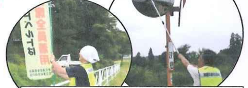
のぼり旗交換とカーブミラー清掃