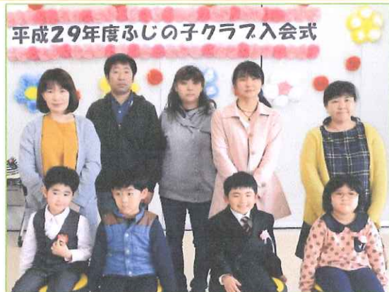
平成29年度ふじの子クラブ入会式

桜の花もそろそろ満開になろうとしている今日この頃ですが、地域の皆さまいかがお過ごしでしょうか？