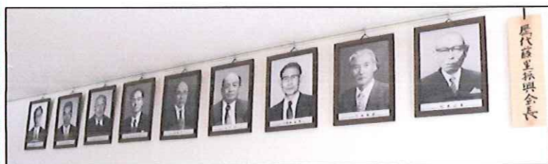
歴代藤里振興会長