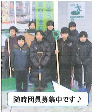
随時団員募集中です♪

12月17日(日)江南ダンスミニバスの藤里団員と保護者のみなさんが地区センターの清掃、雪かきをしてくださいました。大変ありがとうございました。