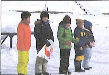
各学年の「天まで届くで賞」をゲット。

1月27日(土)生涯学習部主催の親子ふれあい凧揚げ大会が藤里地区総合運動場で行われました。 各学年に「デザイン賞」、「天まで届くで賞」が贈られました。