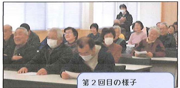
第2回目の様子 講師の楽しいお話に思わず笑みがこぼれます。