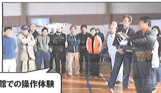
体育館での操作体験