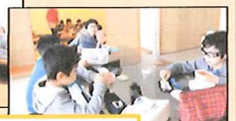
和室や調理室でお弁当を食べます。

地域の皆さま、あけましておめでとうございます。今年もどうぞよろしくお願いいたします。