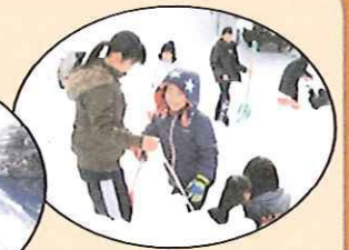
旧児童館の坂でそり遊び。