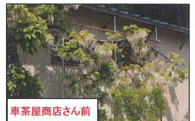
車茶屋商店さん前