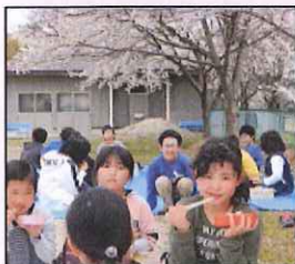
お花見☆ お弁当おいしい☆