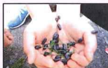
ダンゴムシこんなにいっぱい(*^^)v ひえええ~(>_<)

桜の季節から外遊びが本格的になりました。桜の下でお弁当を楽しみ、カエルやダンゴムシを「かわいい♡」と夢中で捕まえる女の子やそのあたりの木や石を使って縄文風オブジェ作りに精をだす男子、みんな思い思いの外遊びを満喫しています。