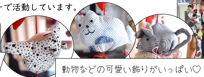
動物などの可愛い飾りがいっぱい♡