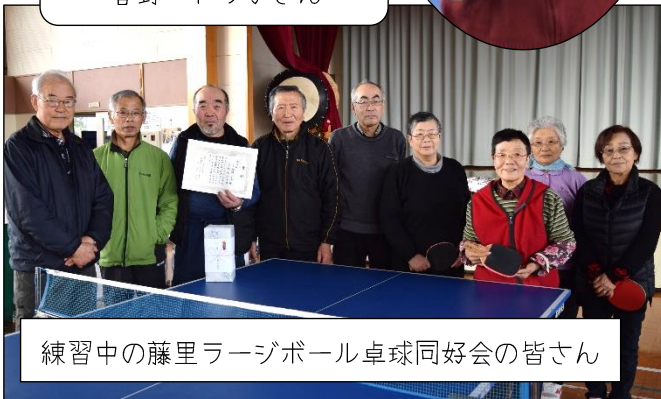
練習中の藤里ラージボール卓球同好会の皆さん