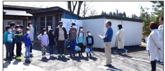
子ども達と一緒に避難場所の確認をしました。

藤里地区センターでは3月31日(火)午前10時から地区センター職員、ふじの子クラブ児童を対象に避難訓練を行いました。万が一の時に冷静な対応をできるように非常放送機器や消火器の使用方法を再確認しました。