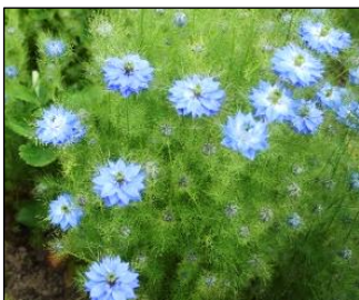
《ニゲラ》(クロタネソウ) 花言葉:「ひそかな喜び」 『深い愛』