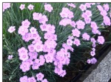
《なでしこ》 花言葉:「純粹」