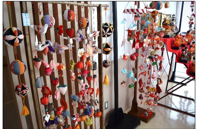
ひな人形も一緒に飾っています🎎

色とりどりの可愛らしい猫や鯛などの人形等多数展示しておりますので、地区センターにお越しの際はぜひご覧ください。