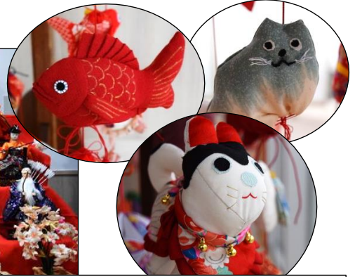
手芸サークル「藤の花」の皆さんありがとうございました。