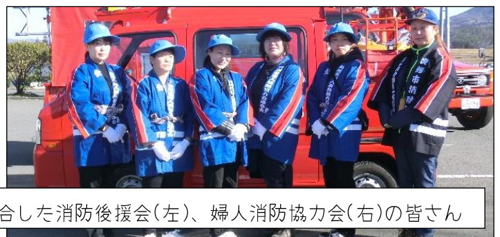
第4部消防屯所に集合した消防後援会(左)、婦人消防協力会(右)の皆さん