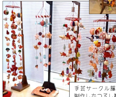
手芸サークル藤の花の皆さんの制作したつるし雛🍡