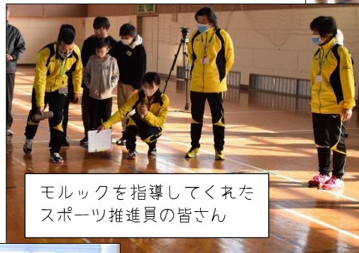
モルックを指導してくれたスポーツ推進員の皆さん