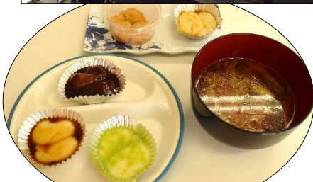
お餅はあんこ・ずんだ・みたらし・きなこ・ショウガ