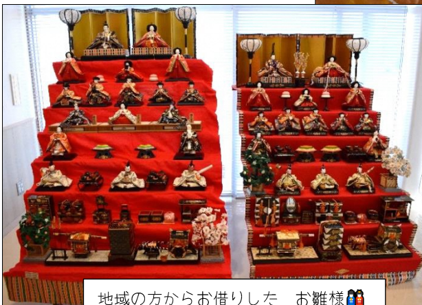
地域の方からお借りした お雛様🍡