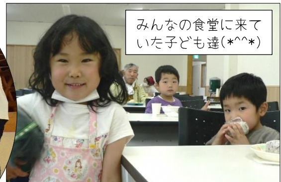
みんなの食堂に来ていた子ども達(*^^*)