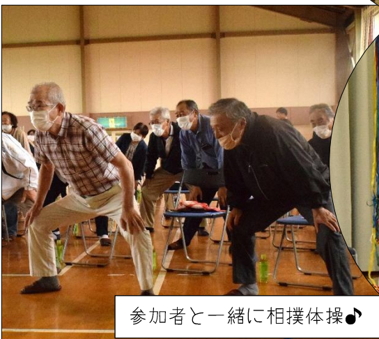
参加者と一緒に相撲体操♪