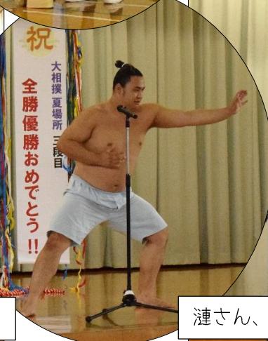
漣さん、全勝優勝おめでとう！