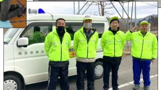
📍 交通・防犯委員会の地区内パトロール

3区自治会では12月14日(日)3区営農センターにて「2025 収穫感謝祭」を行いました。当日は3区全戸に配布する紅白餅や豆腐を作り、その後昼食として作りたてのあんこ餅やきな粉餅、豚汁などを参加者で食べながら楽しい時間を過ごしたそうです。