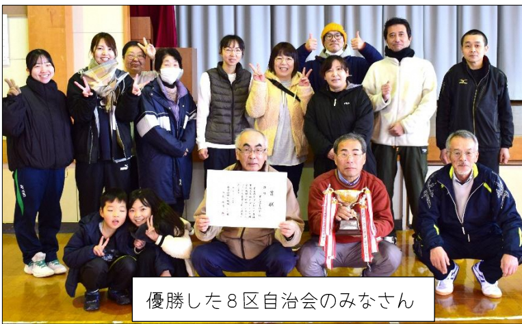
優勝した8区自治会のみなさん