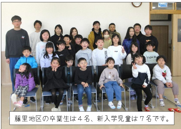
藤里地区の卒業生は4名、新入学児童は7名です。

藤里地区子ども会では3月1日(日)藤里地区センター研修室にて「令和7年度入学卒業を祝う会」を開催しました。当日は卒業生と新入生の紹介をして、その後新聞紙じゃんけんを行い楽しい時間を過ごしたそうです。