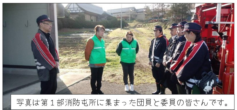
写真は第1部消防屯所に集まった団員と委員の皆さんです。

3月1日(日)藤里地区内にて消防団第14分団と防災対策委員会が火防点検を行いました。火防点検では各部に分かれ火災予防の声かけを行いました。