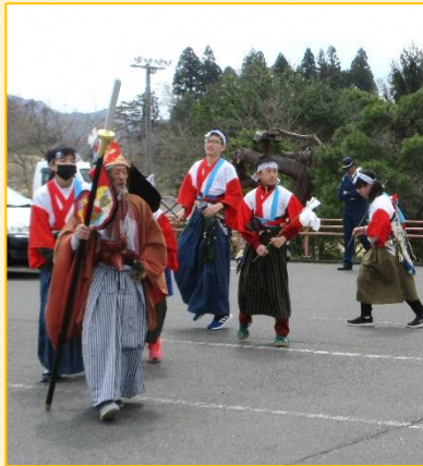
↑写真は去年の様子です！

浅井智福愛宕神社では4月5日(日)春の例大祭を行います。今年度も藤里地区の子ども達による「子供神楽」の披露を行います。詳しい巡行時間や場所は神社で発行する広報をご確認ください。