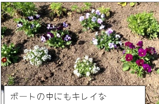
ポートの中にもキレイなお花がたくさん咲いています

4月8日（水）ふじ色ボランティアの女性の方々が藤の森遺跡の花壇の手入れを行っていただきました。色とりどりのキレイな花植えくれました。