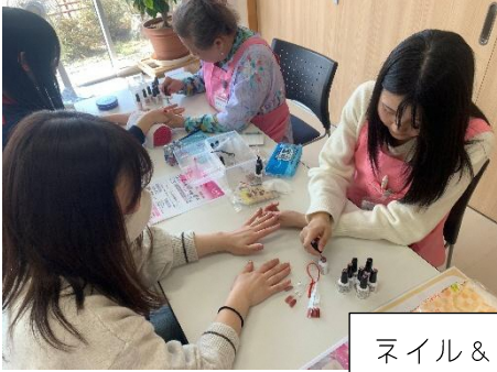
ネイル＆ハンドマッサージ