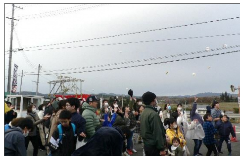
おらほの感謝祭の最後には餅まきを行いました！飛んでくるお餅を皆さん「ナイスキャッチ」★