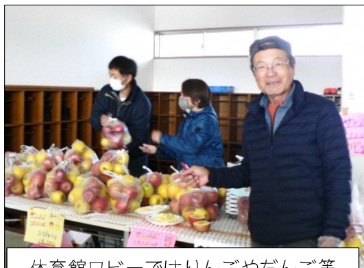
体育館ロビーではりんごやだんご等の販売で賑わいました(*^^*)