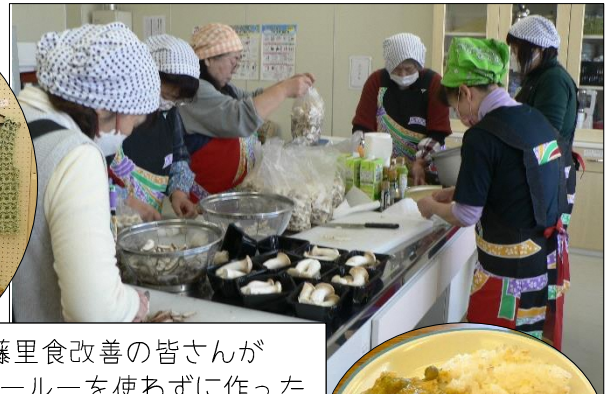
藤里食改善の皆さんがカレーを使わずに作ったキノコスパイシーカレー