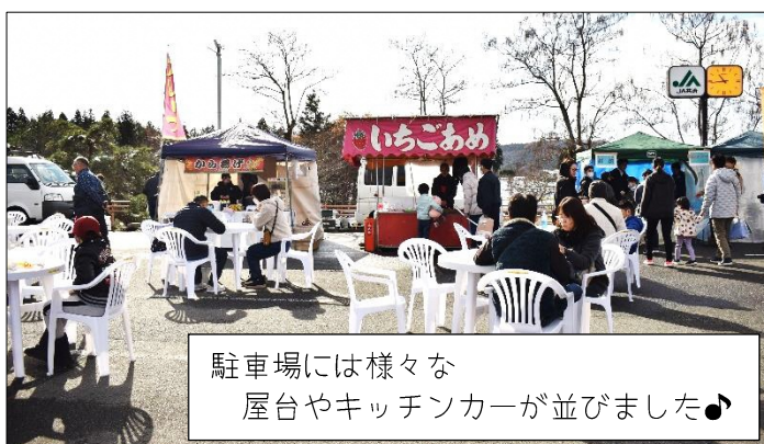
駐車場には様々な屋台やキッチンカーが並びました♪