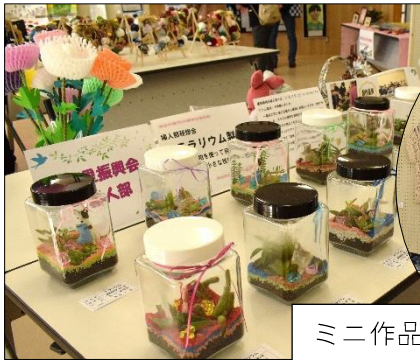
ミニ作品展の様子

朝早くから運営にご協力いただきましたスタッフの皆さん、本当にありがとうございました。