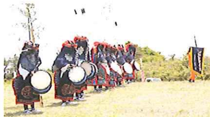
伊手小学校金津流獅子躍