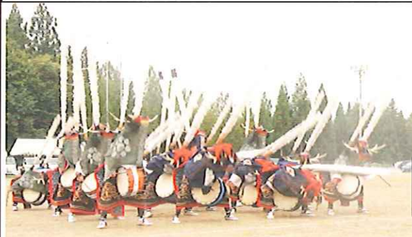
伊手小学校5、6年生「金津流伊手小獅子躍」

9月2日、市と振興会（自主防災組織）が連携し防災訓練を実施しました。市の職員と避難所の設置をし、地区センター備え付けの備品等の確認をすると共に、自治会取組みとして安否確認訓練を行い、振興会三役、各自治会長及び振興会事務局で訓練について評価と意見交換を行いました。特に防災意識の必要性ついて話されました。ごくろうさまでした。