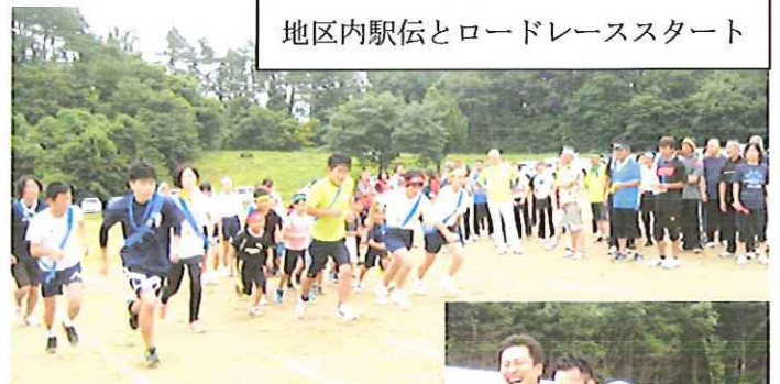
地区内駅伝とロードレーススタート