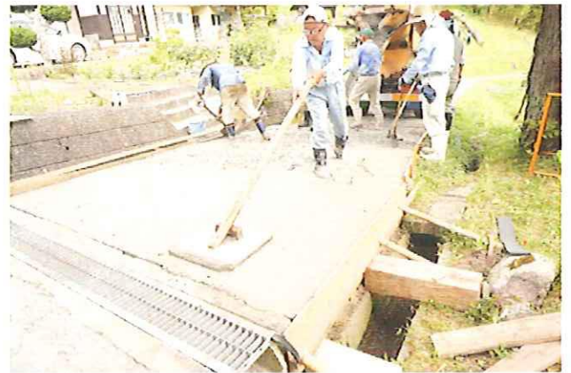
きれいに、ていねいに注意して!