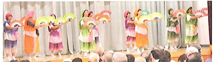
3区婦人会の皆さんによる「Y・M・C・A」「みちのく七福神」