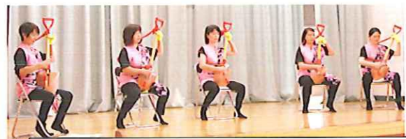
4区婦人会の皆さんによる「スコープ三味線」(上) 「ダンシングヒーロー盆踊り編」(下)