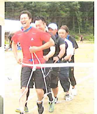
息がピッタリ 第8区のむかでリレー