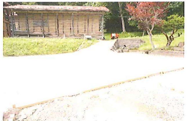
地元住民の皆さんが作業をした「ホワイトロード」です!