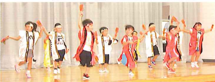
江刺南保育所きりん組・ぞう組・ぱんだ組13名