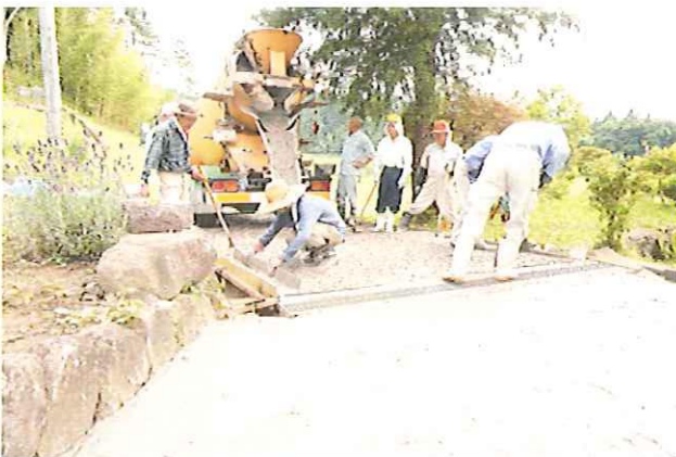
夏の陽ざしの下で、頑張りました!