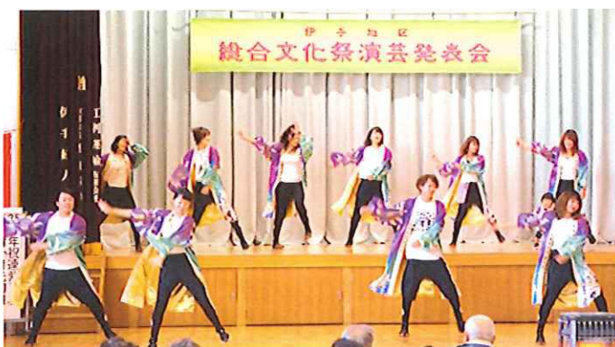
月光幻舞 (25歳年祝連紫月琉)