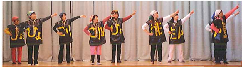
踊り ひよっこりひょうたん島 (7区)