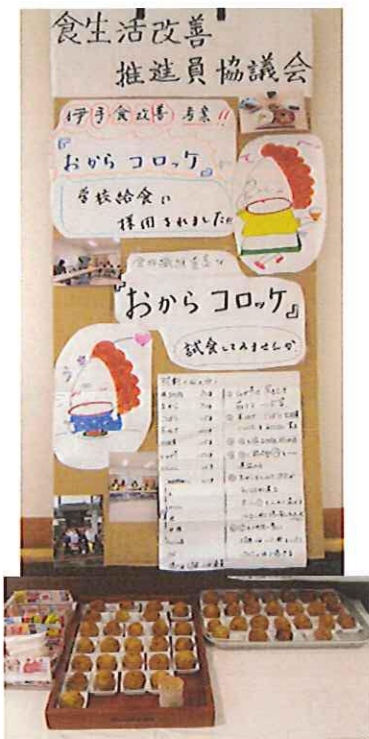
伊手地区食生活改善推進協議会