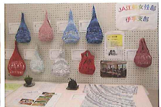
J A江刺女性部伊手支部