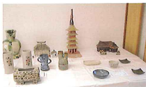
高齢者生産活動センター(陶芸)