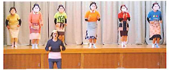
踊り サザエさん体操 (1区)