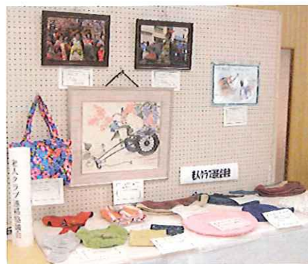
伊手老人クラブ連絡協議会