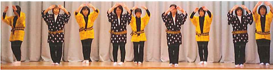
踊り 八戸小唄 (6区)