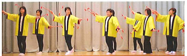
踊り しあわせ太鼓 (2区)