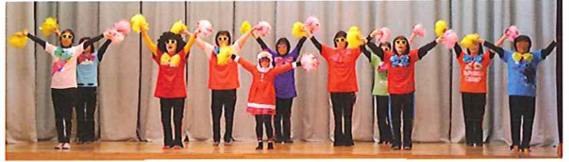
踊り ヤングマン (3区)