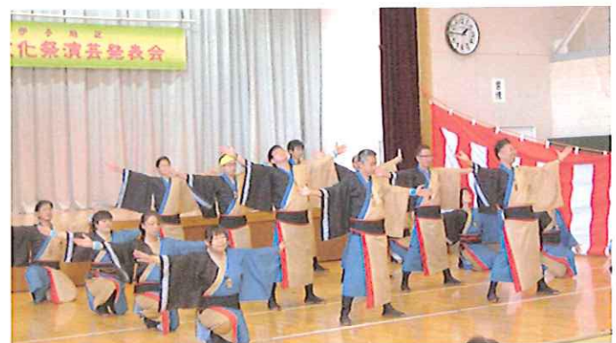
わ (42歳年祝連紀焰会)