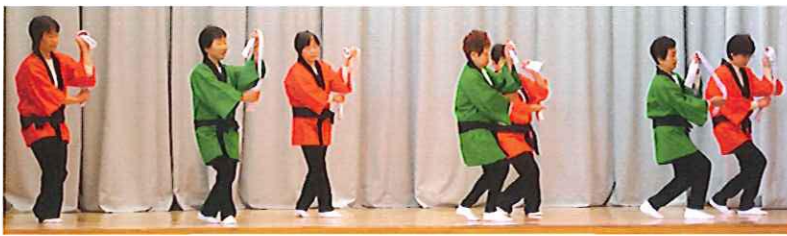
踊り 奥州恋来い音頭 (5区)