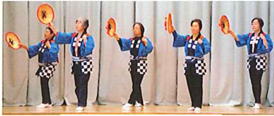
踊り 花笠月夜 (8区)