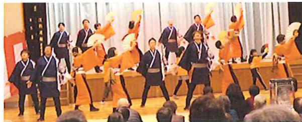
演舞「かがりび」 42歳年祝連 燎仁会の皆さん