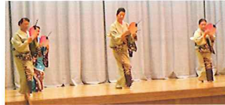
踊り「長良川演歌」 千草会の皆さん