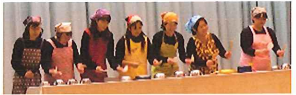
「キッチンバンド」第1区による食器演奏