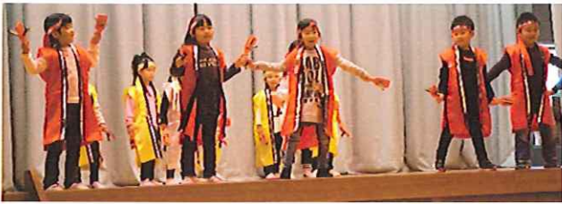
踊り「よさこいソーラン」 江刺南保育所園児の皆さん