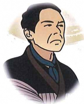
清三郎さんイメージ

記念講演会は、どなたでも参加できますので、この機会に聴講いただきますようご案内いたします。