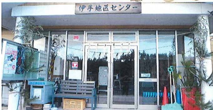
伊手地区センター