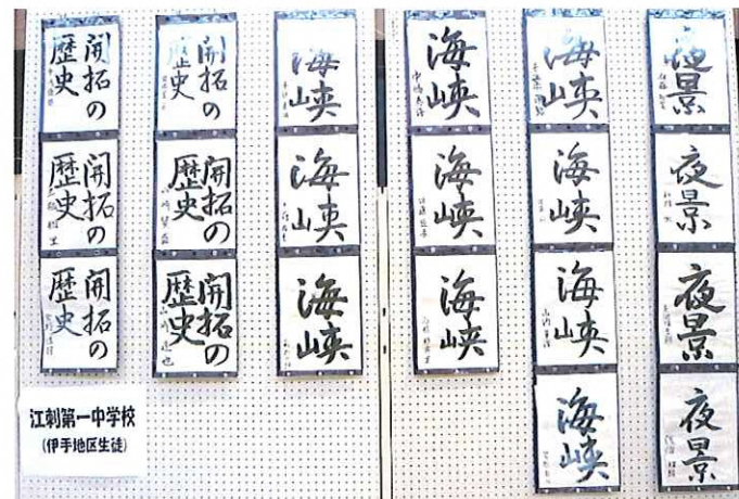
江刺第一中学校 (伊手地区生徒)