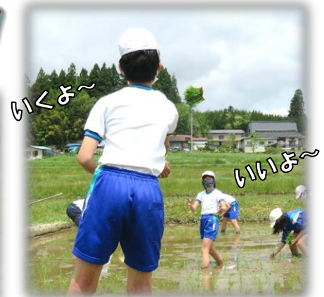
↑ 苗っこを投げて渡します。