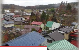
壇ヶ丘からの眺望