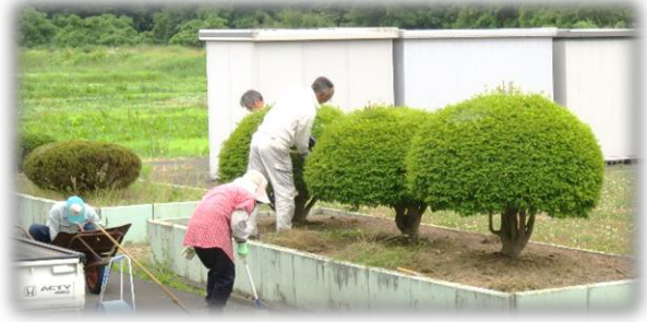
【朗生老人クラブの皆さん】

各单位老人クラブの皆さんに、地区センターの花壇のお手入れをしていただき、スッキリさっぱりとしました！皆さんののおかげでキレイな地区センターを維持できています。ありがとうございます！