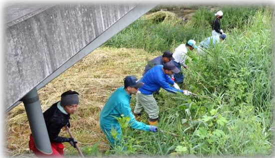
【1区の皆さんの除草作業】

6月28日、河川清掃作業が行われました。地区民の皆様のご協力のおかげで、地区内の災害に備えた河川環境が良好に保たれています。ありがとうございます。大変お疲れ様でした。