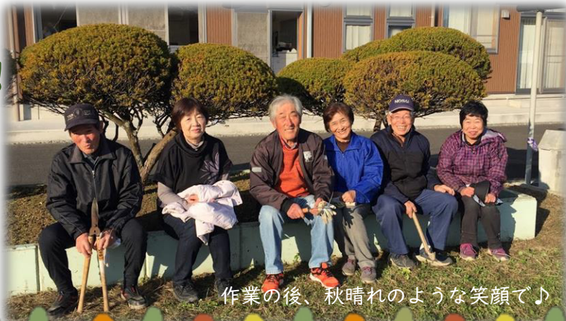
作業の後、秋晴れのような笑顔で♪

玉里老人クラブ連絡協議会の会員の方々には、4つある花壇の整備（年2回）をお願いしています。いつもきれいにしてくださいありがとうございます。