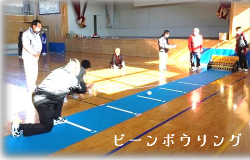
ビーンボウリング