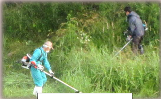
5区自治会の皆さん

6月27日、河川清掃作業が行われました。地区民の皆様のご協力のおかげで、地区内の災害に備えた河川環境が良好に保たれています。ありがとうございます。大変お疲れ様でした。