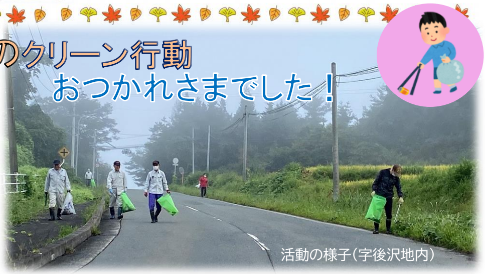
活動の様子(字後沢地内)