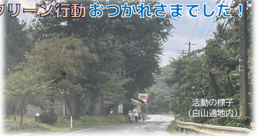
活動の様子 (白山通地内)