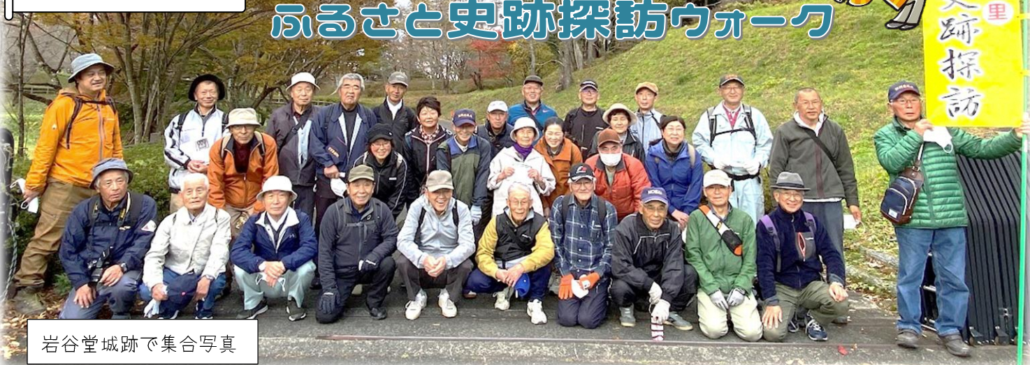
岩谷堂城跡で集合写真

11月5日、ふるさと史跡探訪ウォークを開催しました。今年は33名の方々に参加していただき、岩谷堂にお邪魔してきました！向山公園を出発し、光明寺・多聞寺跡等を見学し夢の架け橋を渡って、岩谷堂城跡周辺を散策しました。距離的には約4kmと長くはなかったのですが、急な坂を登ったりとアップダウンが激しく、お城があったからこそその立地であると、身をもって感じることもできるコースでした。寒い中でしたが、すっかり色づいた紅葉も楽しみながら歴史を学ぶことが出来ました。