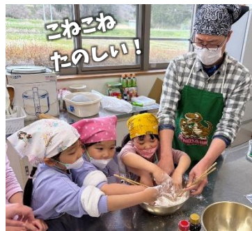
こねこね たのしい！